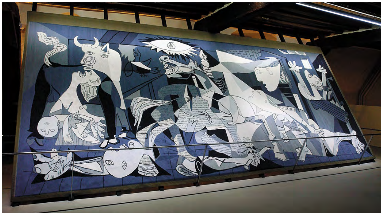
«Guernica» de Pablo Picasso

Eclairage réalisé avec TMTAL, AGA-LED® B-10 / 24V / 1W / 2800K